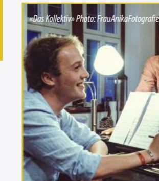
»Das Kollektiv«

Anreise, Touristinformation PKW: A 19, Abfahrt Wittstock, A 24, Abfahrt Heiligengrabe/Pritzwalk Bahn: RE 6 ab Berlin Spandau Tourismsinformation Wittstock T: 03394-433442 www.wittstocker-land.de