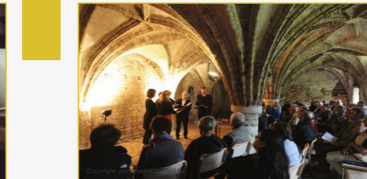
»Das Kollektiv«

Veranstalter Dominikanerkloster Prenzlau Kulturzentrum und Museum Uckerwiek 813, 17291 Prenzlau T: 03984-75261 E: info@dominikanerkloster-prenzlau.de www.dominikanerkloster-prenzlau.de