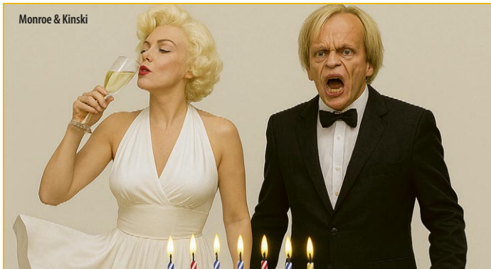
Monroe & Kinski

Karten an allen bekannten Vorverkaufsstellen oder unter event-theater.de