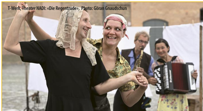
T-Werk, Theater NADI: «Die Regentrude», Photo: Göran Gnaudschun