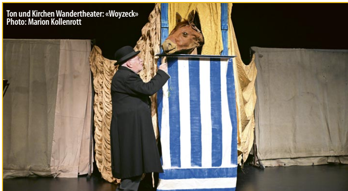
Ton und Kirchen Wandertheater: «Woyzeck»

T-Werk Schiffbauergasse 4 E 14467 Potsdam 0331 73042626 ticket@t-werk.de t-werk.de