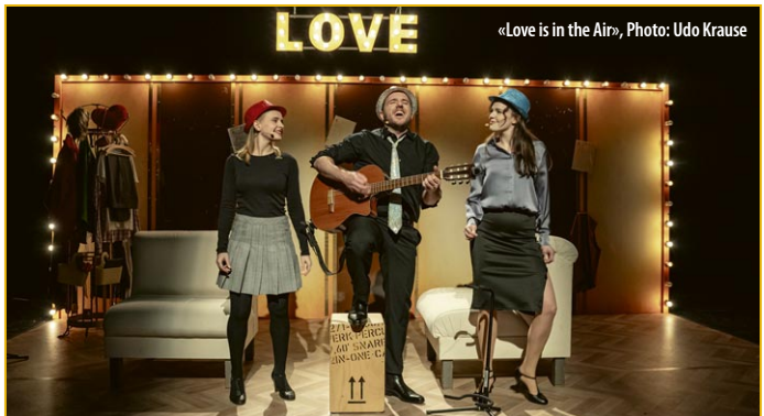
«Love is in the Air»

Dominikanerkloster, 03984-75280 sowie in der Stadtinformation, 03984-75163 uckeroper.de und reservix.de