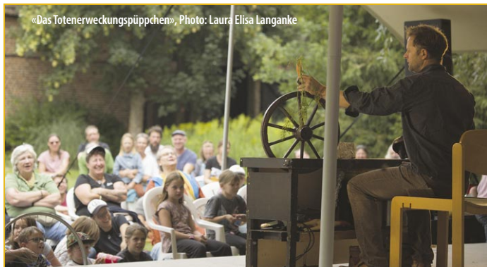
«Das Totenerweckungspüppchen», Photo: Laura Elisa Langanke