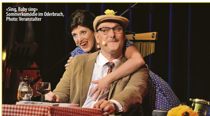
«Sing, Baby sing» Sommerkomödie im Oderbruch, Photo: Veranstalter

Tourist-Information Bad Freienwalde Uchtenhagenstraße 3 16259 Bad Freienwalde 03344-150890 bad-freienwalde.de