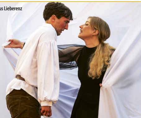
«Die drei Musketiere», Photo: Marcus Lieberenz

theater-poetenpack.de und an allen bekannten Vorverkaufsstellen 0331-9512243