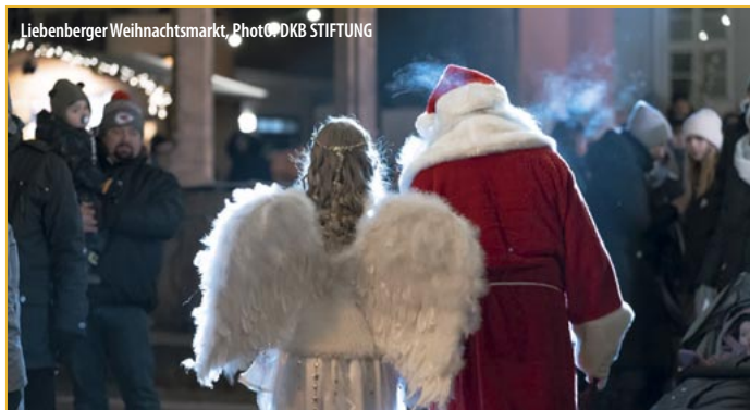
Liebenberger Weihnachtsmarkt, Photo DKB STIFTUNG

Schloss & Gut Liebenberg Parkweg 1a 16775 Löwenberger Land