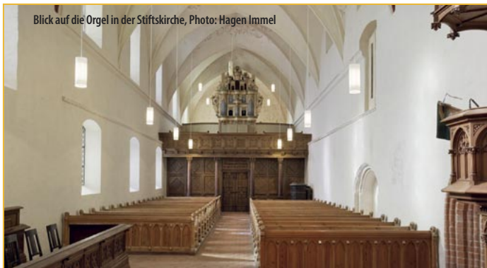
Blick auf die Orgel in der Stiftskirche

An der Abendkasse, für Kinder bis einschließ- lich 12 Jahre ist der Eintritt zu allen Veran- staltungen frei.