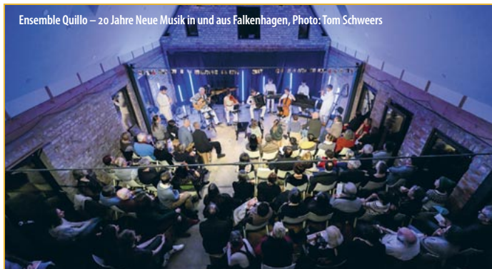
Ensemble Quillo – 20 Jahre Neue Musik in und aus Falkenhagen

Kartenreservierungen und Shuttle-Anmeldung unter reservierung@quillo.net