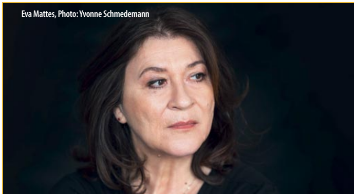
Eva Mattes