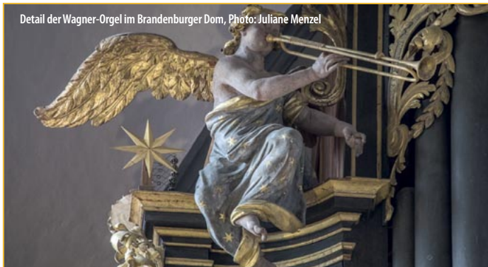
Detail der Wagner-Orgel im Brandenburger Dom, Photo: Juliane Menzel

Bahn: RE1 ab Berlin bis Brandenburg Hbf Touristinformation Brandenburg 03381-796360 www.stg-brandenburg.de