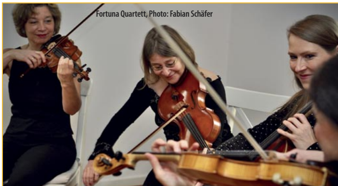
Fortuna Quartett

Havelländische Musikfestspiele gGmbH Schloss Ribbeck, Theodor-Fontane-Str. 10 14641 Nauen OT Ribbeck, 033237-85963 info@havellaendische-musikfestspiele.de www.havellaendische-musikfestspiele.de 033237-8596-3, www.reservix.de