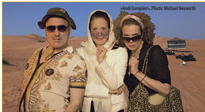
«Andi Europäer»