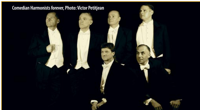
Comedian Harmonists forever, Photo: Victor Petitjean

Bahn: von Berlin oder Cottbus mit RE1, RB43 oder RE10 nach Neuzelle, ab Bahnhof Neuzelle 15 Minuten Fußweg Besucherinformation Neuzelle 033652-6102, tourismus@neuzelle.de www.tourismus.neuzelle.de