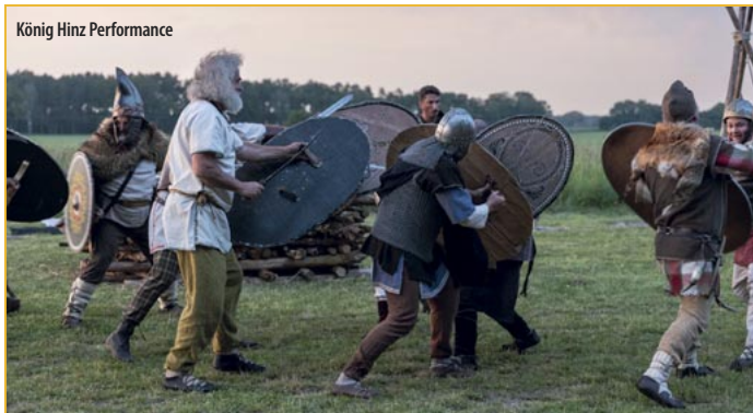
König Hinz Performance