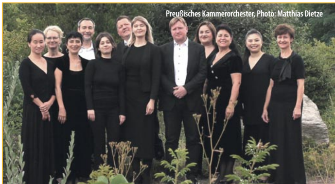
Preußisches Kammerorchester

Uckermärkische Kulturagentur gGmbH Geschäftsführender Direktor: Jürgen Bischof Grabowstraße 18, 17291 Prenzlau 03984-833974 kontakt@umkulturagenturpreussen.de www.umkulturagenturpreussen.de