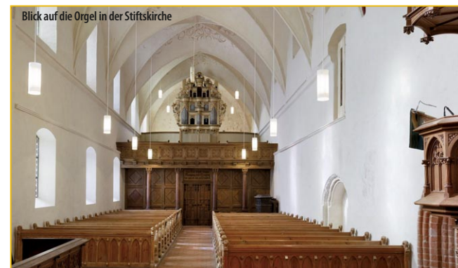
Blick auf die Orgel in der Stiftskirche