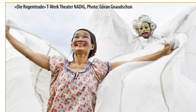
«Die Regentrude» T-Werk Theater NADIG, Photo: Göran Gnaudschun

Theater-Show nach einer wahren Begebenheit