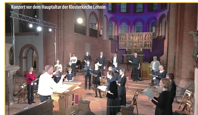
Konzert vor dem Hauptaltar der Klosterkirche Lehnin

Veranstalter, Kartenservice Ev. St. Marien-Klosterkirchengemeinde Lehnin, Klosterkirchplatz 20, 14797 Kloster Lehnin, www.klosterkirche-lehnin.de Kartenvorverkauf: T: 030-80908070 musik@klosterkirche-lehnin.de